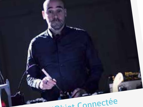
La Cité de l'Objet Connectée